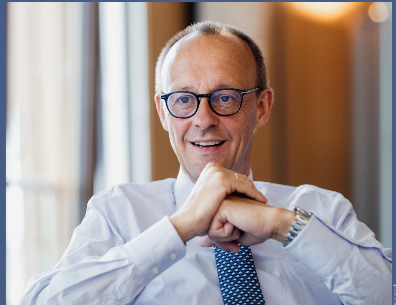
Friedrich Merz Vorsitzender der CDU/CSU-Fraktion

Der „Öko-Sozialismus“ hingegen, wie er von links gefordert wird, beruht auf Verboten und Vorschriften. Mit diesem Konzept würden noch mehr Unternehmen unser